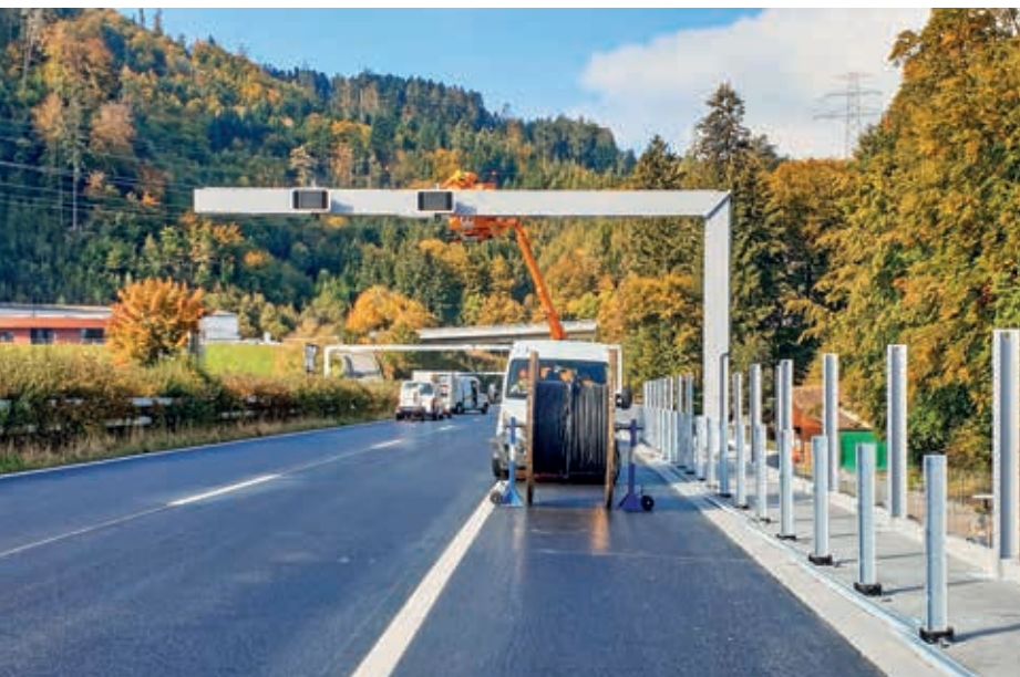
Installationsarbeiten auf der A8 östlich des Rugentunnels.

Dieses Jahr wurden auf der A8 im Abschnitt Interlaken-West-Interlaken-Ost sowie beim Soliwaldtunnel umfangreiche Eingriffe abgeschlossen. Die Infrastruktur ist dort nun auf dem neusten Stand und bietet insbesondere auch ein höheres Sicherheitsniveau.